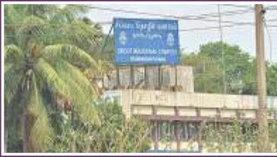
SIPCOT INDUSTRIAL COMPLEX