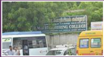
RMD ENGINEERING COLLEGE