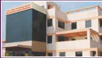
THE INSTITUTE OF ROAD TRANSPORT