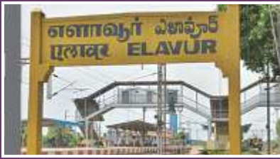
ELAVUR RAILWAY STATION